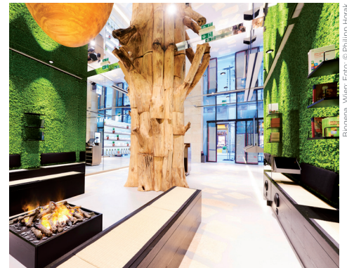
Belagena, Wien

Erfahren Sie also, welche psychologischen Mechanismen und ladendramaturgischen Kunstgriffe hinter diesen und anderen Retail Secrets stehen: Lernen Sie von Wien.